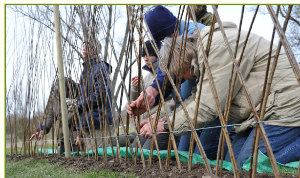
Haie à croisillons