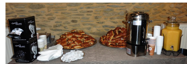
Catering en salle