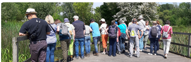
Profitez des extérieurs (4 ha) , respirez l'air pur, écoutez le silence, et laissez-vous inspirer par la beauté de la nature et du patrimoine !

Hébergement : au sein d'un l'ancien Moulin rénové, 55 lits sont répartis dans 9 chambres confortable. .